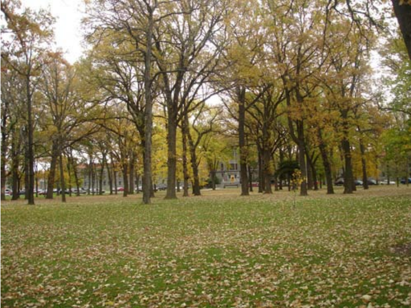
Lá vàng bắt đầu rơi trước sân tù Green field