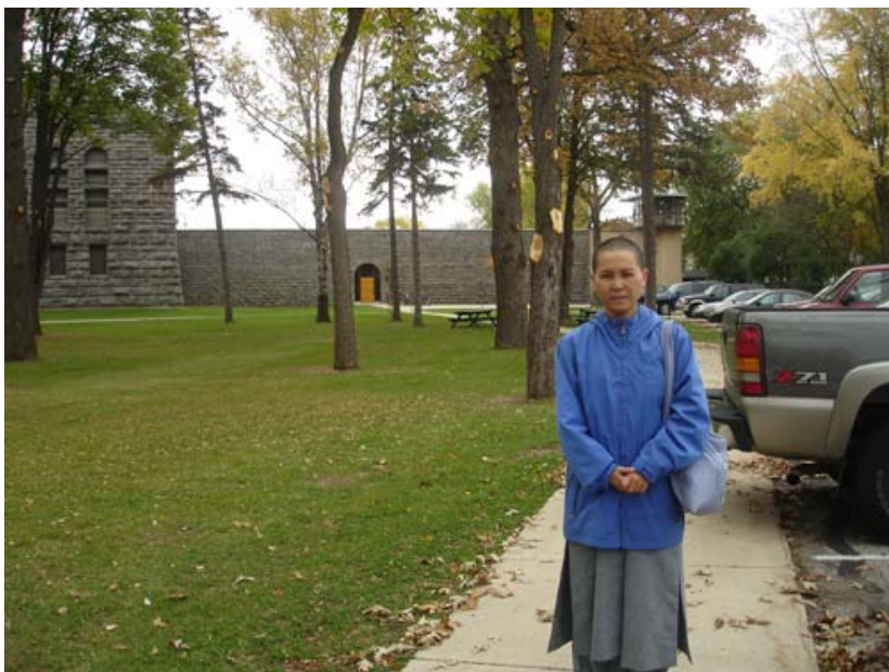
Trước cổng trại tù Green field